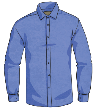
une chemise bleue