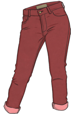
un pantalon rouge