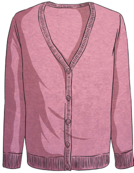
un cardigan rose

These are the clothes for sale in a magasin de vêtements :