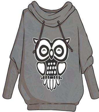
un pull gris