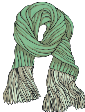
une écharpe verte