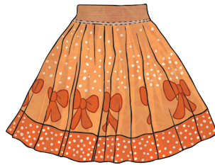
une jupe orange