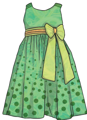
une robe verte