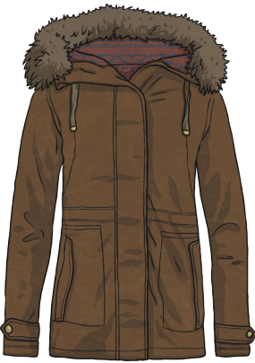
un manteau marron